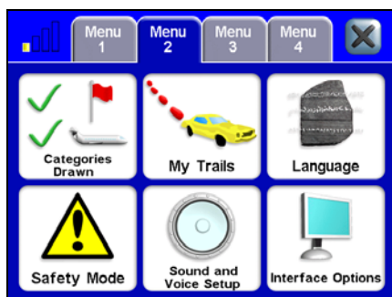
Page 2 du Menu Principal.